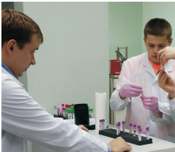
Рис. 1. Участники проекта проводят рандомизацию биологического материала

В экспериментах использована модель психоэмоционального стресса "запах хищника". В экспериментах определено соотношение между выраженностью когнитивных расстройств (тревожность, депрессия, страх, гипертормозимость), уровнем кортикостерона и состоянием эндогенных молекулярных протекторных систем. При этом изучены показатели оксидативного/нитрозативного стресса, уровень стрессорных гормонов и активность ферментов их тканевого метаболизма.