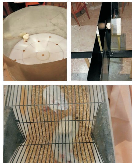
Рис. 3. Изучение когнитивных реакций при ПТСР на животных моделях