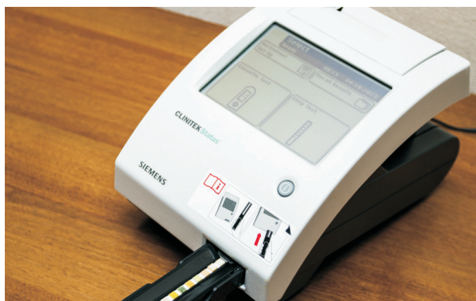
Рис. 5. Экспресс-анализатор мочи