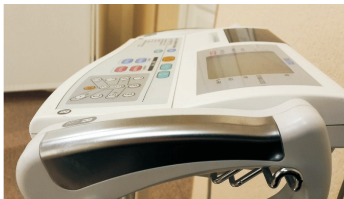
Рис. 2. Анализатор состава тела