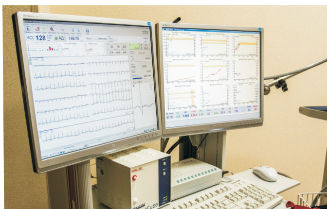
Рис. 1. Динамика ЭКГ при нагрузке

Скоро в лаборатории появится новое оборудование: полидинамометр – прибор для измерения силы различных групп мышц в разных углах, а также прибор для анализа биомеханики. Он будет действовать через специальные маркеры, которые крепятся на теле человека, фиксируют изменения положения тела в пространстве и передают эти данные на экран, преобразуя их в 3D-модель. Аппарат будет показывать: есть ли какие-то отклонения во время движения, проблемы или отклонения опорно-двигательного и вестибулярного аппарата.