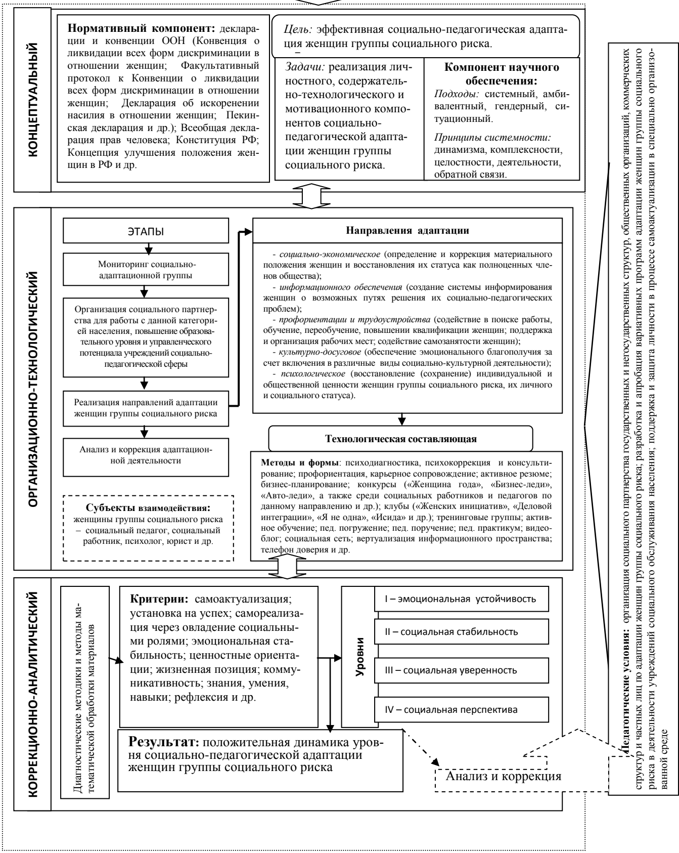
Рис. 1. Модель управления социально-педагогической адаптацией женщин группы социального риска

Социальный заказ – потребность общества в социально активной, социальной мобильной, обладающей личностной культурой женщине, ориентированной на социально-значимый успех и позитивную самореализацию