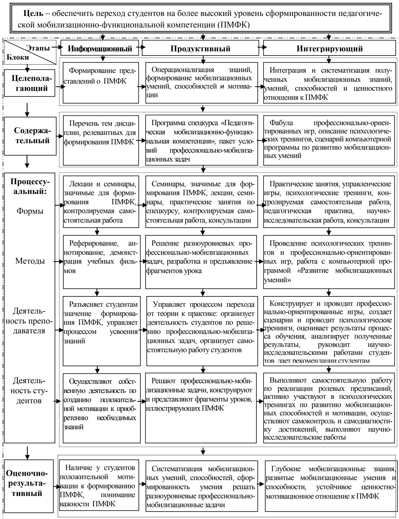
Рис. 1. Модель формирования педагогической мобилизационно-функциональной компетенции студентов вуза