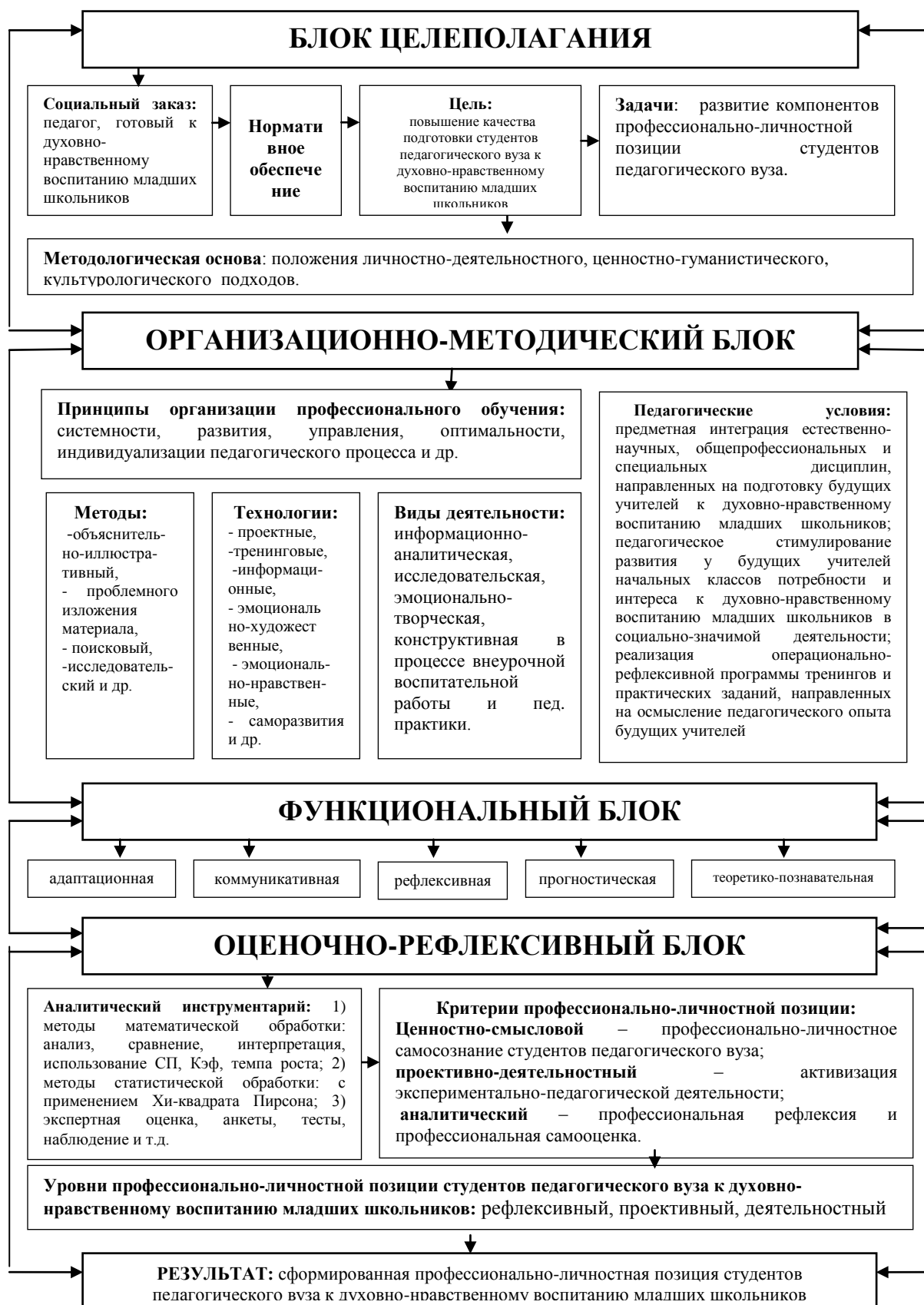
Рис. 1. Структурно-функциональная модель подготовки студентов педагогического вуза к духовно-нравственному воспитанию младших школьников