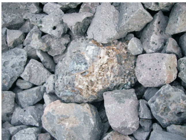
Рис. 1. Образец отвального шлака

6. Проведены работы по комплексному изучению шлаковых отвалов Златоустовского металлургического завода – химического и фракционного состава шлаков, объёмов, местоположения и условий возможной транспортировки. Проведён комплексный анализ химического и фазового состава отвальных шлаков ОАО "ЗМЗ" (рис. 3). Методом локальной рамановской (КР) спектроскопии установлено, что оксидные компоненты шлаков не образуют самостоятельных фаз, а входят в состав сложных соединений. Анализ данных, полученных при определении физико-механических свойств, показал, что отвальные шлаки ОАО "ЗМЗ" могут быть использованы в качестве щебня, песка и щебеночно-песчаных смесей для дорожного строительства, заполнителя и слабоактивного материала для получения шлакоблоков, абразивных шлаковых материалов, флюсов для вагранок, материала для закладки шахтных выработок, вяжущего для укрепления грунтов при строительстве автодорог, а также материала для обратной засыпки.