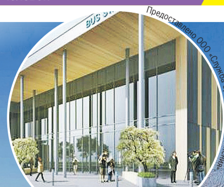
Подъезжающий автобус пассажиры смогут увидеть через стекло.

районе не идет, - отметили в пресс-службе администрации Челябинска. - Строительство там действительно ведется, но, согласно выданному в 2016 году разрешению, возводится автомобильный центр.